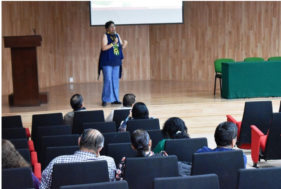
Plática a cargo de la Secretaria Académica y el Jefe del Departamento de Servicios Tecnológicos de la UTNeza, dirigida al personal docente